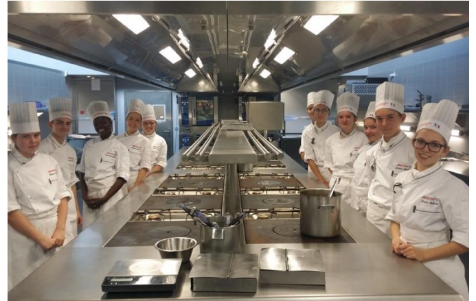
Nouvelles cuisines du lycée hôtelier de Guyancourt.

La rénovation STHR décrite par les programmes parus au Bulletin Officiel du 2 avril 2015 a été mise en œuvre à la rentrée 2015 en classe de seconde. La démarche pédagogique affirmée est celle de la voie technologique, ancrée dans des contextes authentiques de l'hôtellerie, de la restauration et du tourisme. Les contenus d'enseignements sont structurés en thèmes, questions, capacités, notions et objets d'enseignement afin de guider les professeurs dans leur pratique. Lire la suite en ligne .