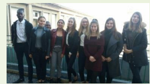
Tle Bac Accueil Lycée N.Dame - Evreux

Retrouvez-nous sur Facebook : Cliquer ici