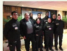
Elèves métiers de la sécurité