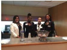
Apprentis GA et Vente

Un travail de qualité et un projet collaboratif effectués par les apprentis en Gestion-Administration et en vente du lycée J Prévert de Versailles (dans la conception des invitations et l'accueil des congressistes, la proposition de produits régionaux et à l'adhésion à l'association), par les élèves du lycée Blériot de Trappes (dans la sécurité des congressistes par les Bac Pro Métiers de la Sécurité et la réalisation d'un questionnaire de satisfaction) et des élèves du lycée Notre Dame d'Evreux (qui ont assuré la réalisation des badges d'accès). Le compte-rendu est publié sur le nouveau site de l'association ci-dessous. Cap maintenant sur le congrès 2018 qui fêtera les 35 ans de l'APV et qui nous le souhaitons réunira encore plus de professeurs.